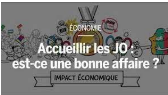
Vidéo Dessine moi l'éco

Doc 1 - Les JO de Paris 2024 : combien ça coûte et combien ça rapporte ?